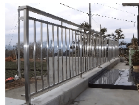
オリジナル・エクステリア製品