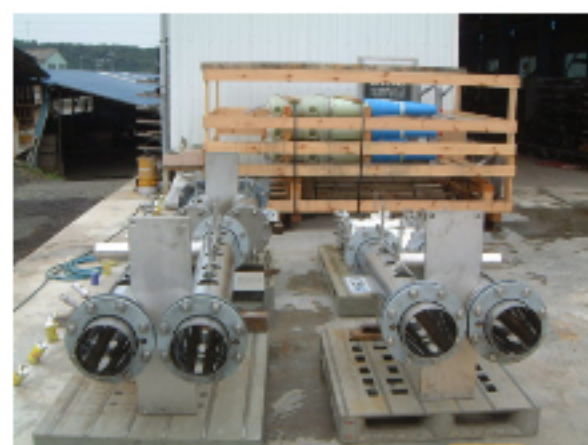
機械部品製作 ステンレス・SS材の製作品